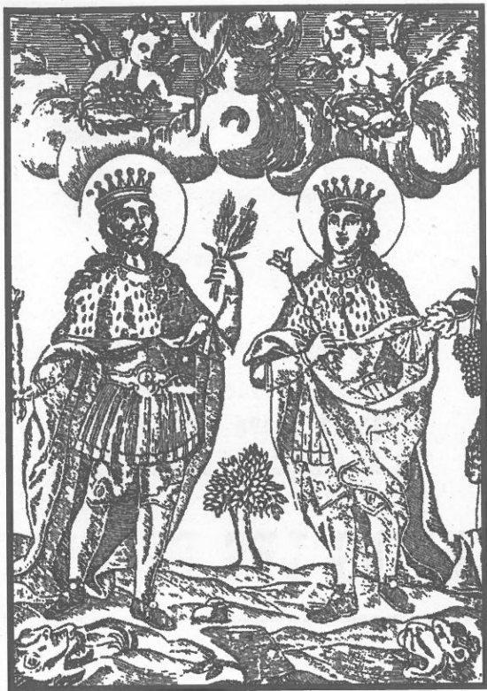
Sants Abdon i Senent ELS SANTS DE LA PEDRA